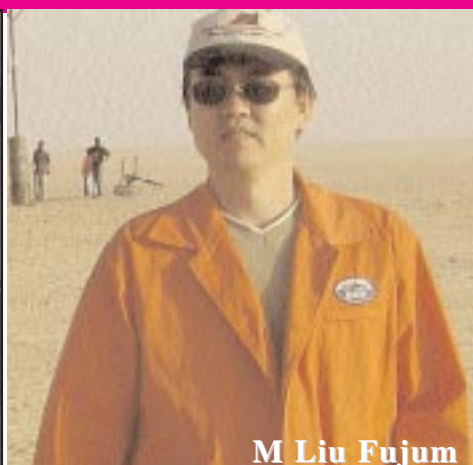
M Liu Fujum

Aïr-Info Votre mensuel d'informations générales