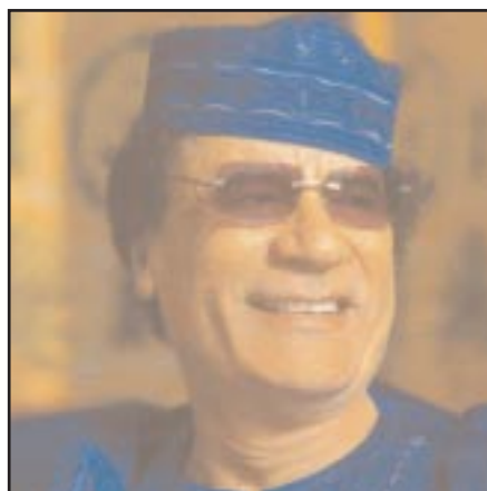
Moammar El. Kadafi