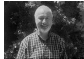
Claudy le Bretton côte d'Armor